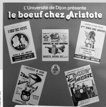
Microsilons. Un 33 tours live retraçant les bœufs de l'Amphithéâtre Aristote de l'université de Dijon.

Le premier disque de jazz enregistré en Bourgogne fut peut-être celui publié par l'Université de Dijon à la fin des seventies... Un live retraçant les bœufs de l'Amphithéâtre Aristote, quand les Jazz à la coque, les Jazzogènes ou Frédérique