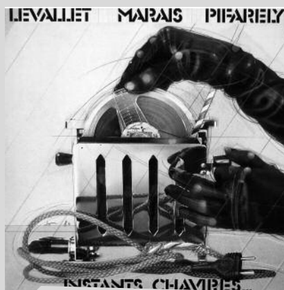
Saphir. Instants chavirés 1 er 33 tours enregistré par LMP chez Jacky Barbier.